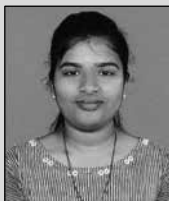
കെൻ മറിയം റോയ് സെന്റ് മേരീസ് കുട്ടംപേരൂർ വേദവാക്യം ഭദ്രാസനം 2nd